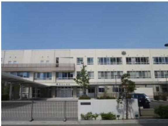
新潟市立笹口小学校