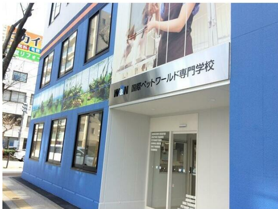
国際ペットワールド専門学校

※この図面はATBBの物件情報の一部を抜粋して掲載しております。(現況優先)※入居日・引渡日変更や付帯条件、別途料金が発生する場合がありますのでご確認ください。