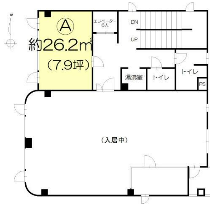
間取り図の(A)部分のみ募集中。