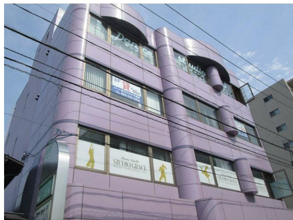
H27年4月、外壁塗装改修工事済み