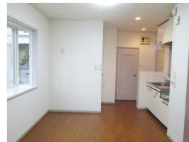
窓があり明るいです