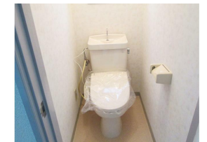
ウォシュレット完備！