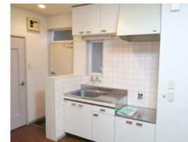
都市ガスのキッチン。まな板も置けます♪