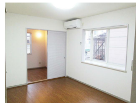
出窓、エアコン、照明器具付き。