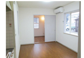
光回線・WiFi インターネット無料。

※この図面はATBBの物件情報の一部を抜粋して掲載しております。（現況優先）※入居日・引渡日変更や付帯条件、別途料金が発生する場合がありますのでご確認ください。