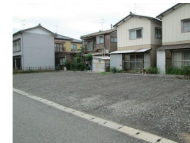
駐車場2台（縦列）なので家族や来客時にも安心です