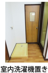
室内洗濯機置き場

※この図面はATBBの物件情報の一部を抜粋して掲載しております。（現況優先）※入居日・引渡日変更や付帯条件、別途料金が発生する場合がありますのでご確認ください。