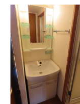
(同物件別室参考用写真)