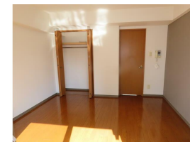
(同物件別室参考用写真)