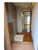
(同物件別室参考用写真)