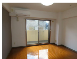
(同物件参考用写真)