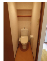
(同物件別室参考用写真)