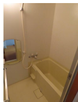
(同物件別室参考用写真)