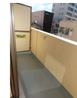
(同物件別室参考用写真)

※この図面はATBBの物件情報の一部を抜粋して掲載しております。（現況優先）※入居日・引渡日変更や付帯条件、別途料金が発生する場合がありますのでご確認ください。