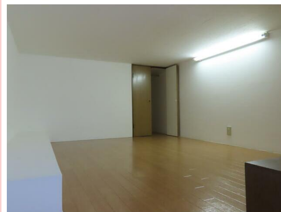
ロフト5帖（照明やコンセント付）と、奥には収納（ハンガーパイプ付）有り