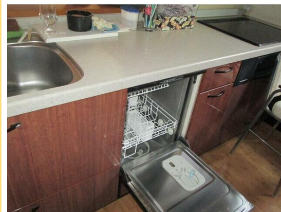
(写真の生活用品は撤去します)