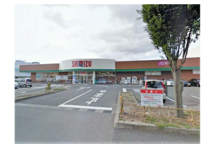
清水フードセンター中山店

※この図面はATBBの物件情報の一部を抜粋して掲載しております。(現況優先) ※入居日・引渡日変更や付帯条件、別途料金が発生する場合がありますのでご確認ください。