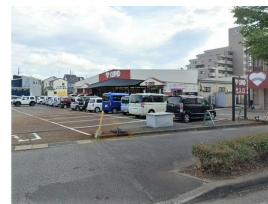
キューピット中山店