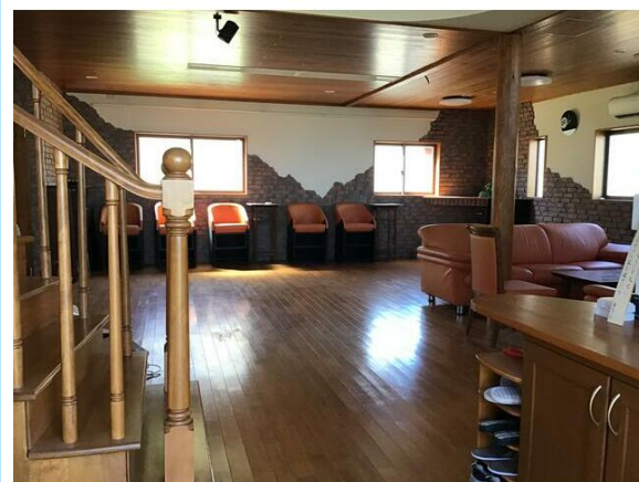
玄関から見た様子