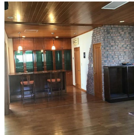
1階にはホームバーが有ります