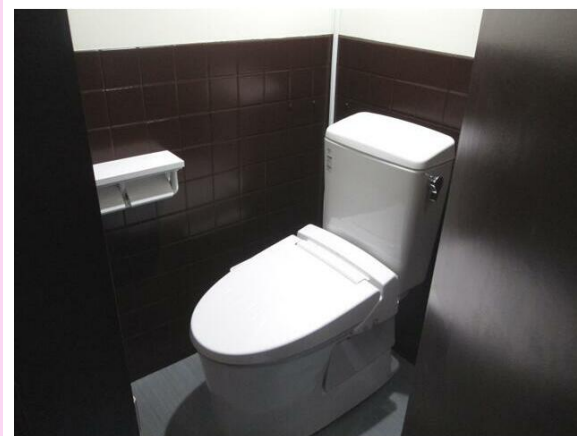
フロアごとに男女別トイレ有り