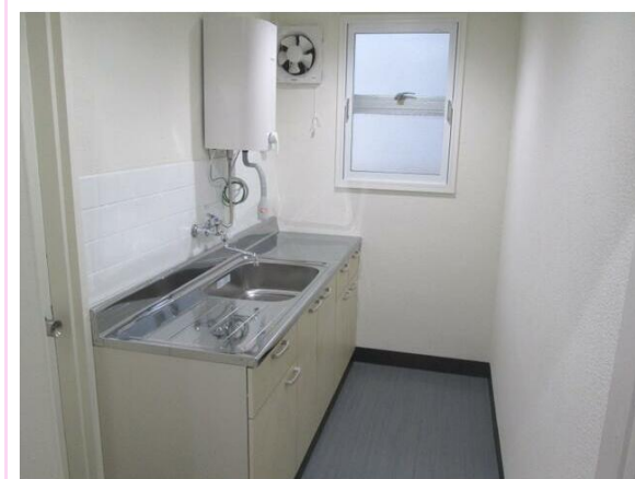
フロアごとに共有給湯スペース有り

※この図面は物件情報の一部を抜粋して掲載しております。(現況優先) ※付帯条件や別途料金が発生する場合がありますのでご確認ください。