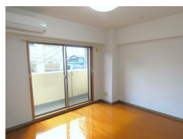
(同物件別室参考写真)