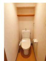
(同物件別室参考写真)