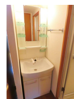
(同物件別室参考写真)