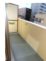
(同物件別室参考写真)

※この図面はATBBの物件情報の一部を抜粋して掲載しております。（現況優先）※入居日・引渡日変更や付帯条件、別途料金が発生する場合がありますのでご確認ください。