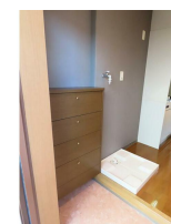
室内洗濯機置き場 (同物件別室参考写真)