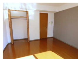
(同物件別室参考写真)