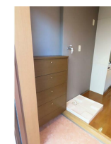
室内洗濯機置き場