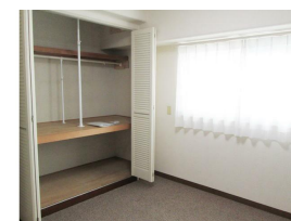
5帖の洋室2つはカーペット