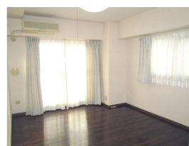
リビング隣の洋室