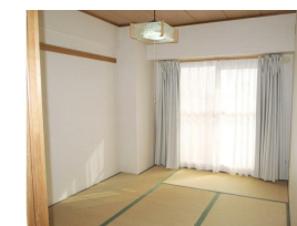
リビング隣の和室 ※入居時に畳表替えします