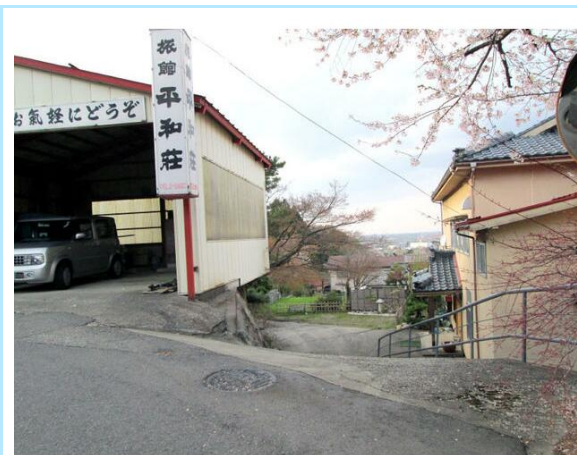
ガレージの横のスロープが入口です。ガレージは売買に含まれません。