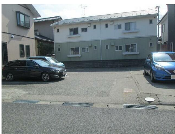
契約後、駐車場アスファルト解体更地渡し